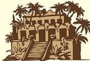
Hanging Gardens of Babylon