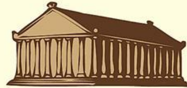
Temple of Artemis at Ephesus