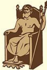
Statue of Zeus at Olympia