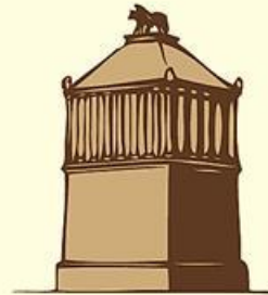
Mausoleum at Halicarnassus