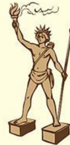
Colossus of Rhodes